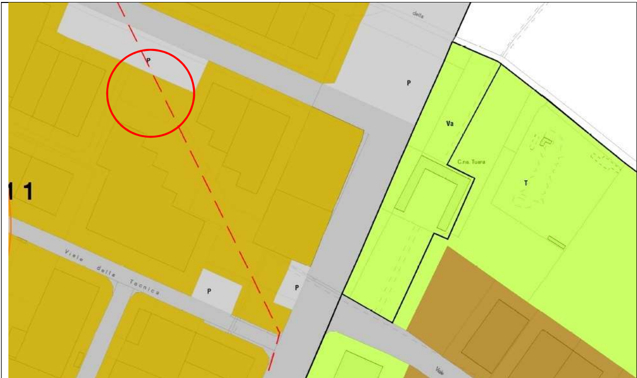
Stralcio di P.R.G.C. – TAV 7.1 - SCALA 1:2000